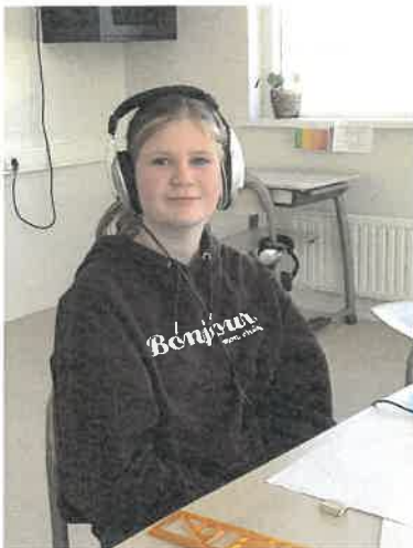
Ammi-El Baljeu - Beeld & tekeningen