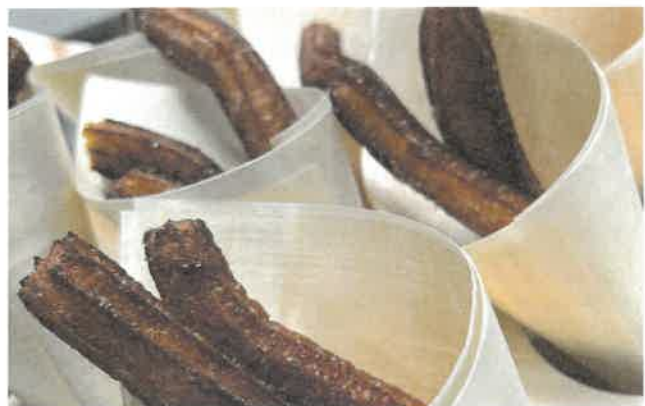
Churros met chocoladedip