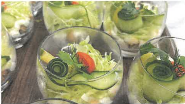
Een gezond voorgerechtje - komkommerrollen en kip en salade. Het was heel lekker vonden de mensen

Op 23 januari was het Atalant Restaurant geopend. Het thema was 'Lekker Mexicaans'. In de keuken werkten 8 leerlingen, in de bediening 9 leerlingen. In het restaurant zaten 42 ouders, broers, zussen, opa's en oma's te wachten op wat er zou komen.