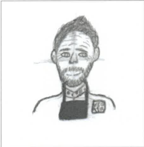
Dit is: ... A