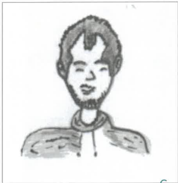
Dit is: ... C