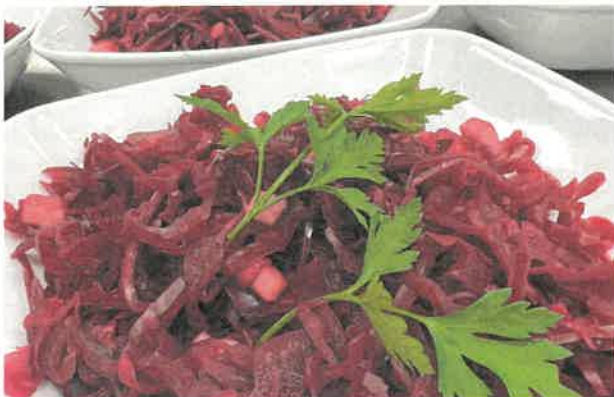
Lekkere rode kool met bladpeterselie

Uit het gastenboek: 'Wow wat hebben wij genoten: de bediening, de keuken en de muziek die maakte het helemaal compleet'