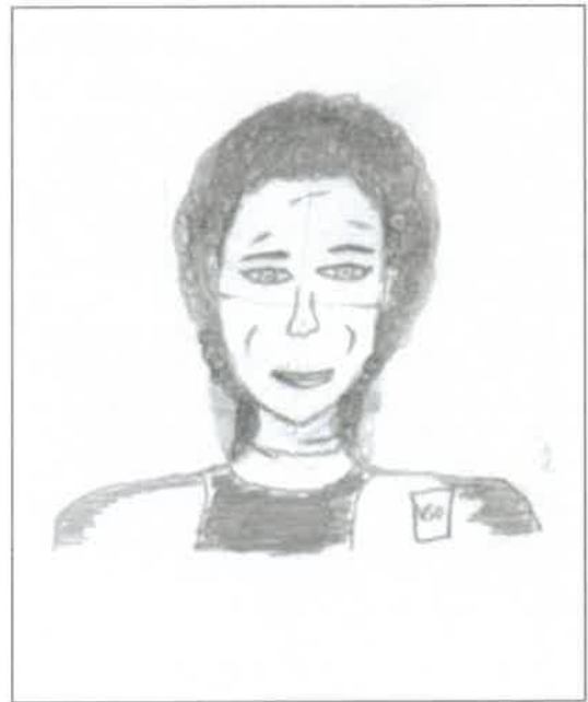
Dit is: ... B