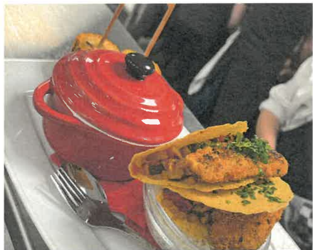
Hoofdgerecht - taco's met vlees. Het thema was 'Mexicaans'

Uit het gastenboek: 'Fantastische avond gehad en wat een heerlijk eten'